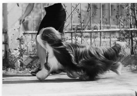
Movimento non corretto: Testa portata alta, coda al limite, posteriore scalciante