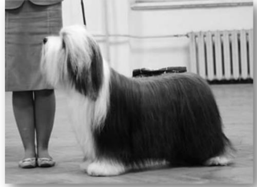
Testa troppo grande rispetto al corpo