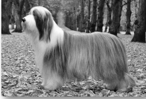
Testa e corpo correttamente proporzionati