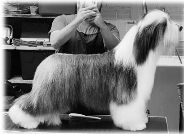
Toelettatura non ammessa: cane piastrato, tagliato e modellato

labbra. A partire dalle guance, dalle labbra inferiori e dal sottomento, il pelo aumenta di lunghezza verso il petto, formando la tipica barba.